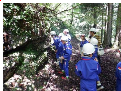
4年やまのご学習 6/13 高山キャンプ場で森林体験や火起こし体験にチャレンジをし ました。暑い中でしたが、最後までやり遂げることができ、子 どもたちは疲れたけど楽しかったと感想を述べていました。