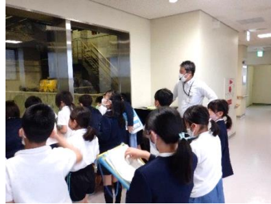
4年リサイクル学習 5/19 刈刈外プラザを見学し、ごみ処理について話を聞きました。ごみ を減らしていきたいという感想を多くの子が持ったようです。