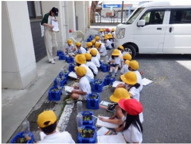
1年あさがおの観察 6/5 あさがおの成長の様子をが んばって記録しました。