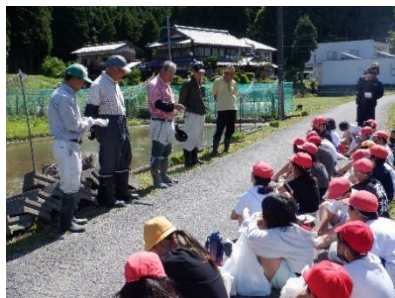
5年たんぼのご学習 5/24 地域のボランティアの方に教わりながら、田植えを初めて体験 しました。素足で泥の中に入るのは意外と気持ちがいいという 声が多く聞かれました。