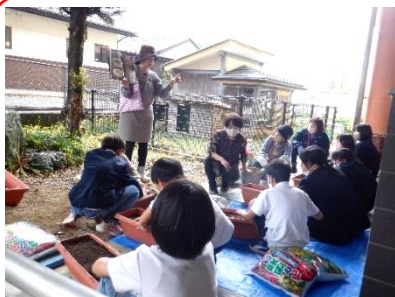
花いっぱい活動(お花の先生) 5/29 花の種を地域の方と共に植え ました。きれいな花が咲くよ うに育てていきたいです。