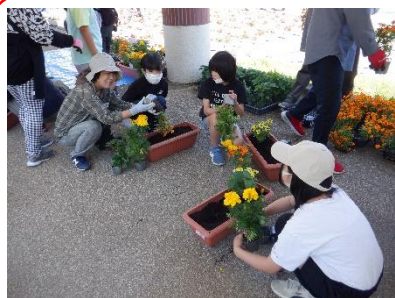
プランター交流会 in 河南中 6/17 3名の児童がボランティアで 参加をしました。作ったプラン ターは玄関横に飾っています。