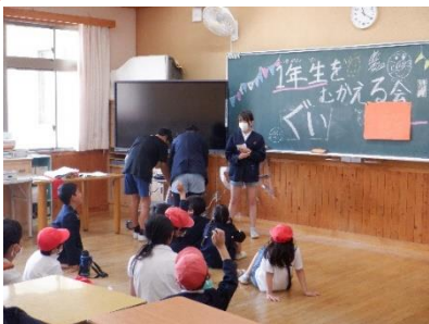
1年生を迎える会 5/23 1年生が楽しめるように、たて わり班ごとに高学年が一先懸 念に企画を考えて行いました。