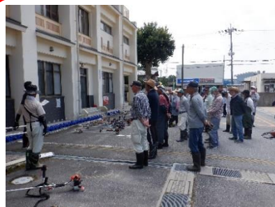
ゴミ0デー活動 5/30 地域の方と協働しながら校地内の除草活動に取り組みました。 多くの地域の方にご協力いただき、感謝をしながら子どもたち は喜んで作業に励みました。