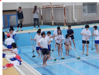
プール清掃 5/30 6月からの授業に向けて、5、6年生がきれいなプールにしようと頑張りました。