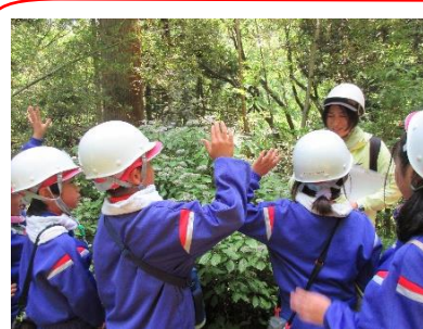
4年やまのご学習 6/11 天候にも恵まれ高山キャンプ場で、森林観察や川の生き物調べに取り組みました。自然環境の大切さを学びながら、みんなで協力して楽しく活動し、学校での事後のまとめでは、タブレットを使って上手に発表することができていました。