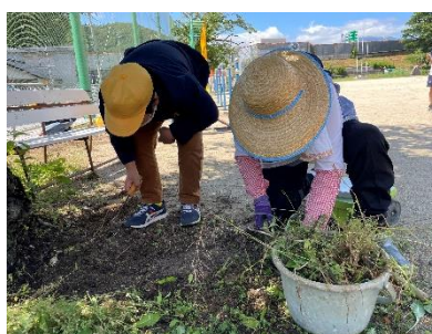
ゴミ0活動 5/29 多くの地域の方々にご協力をいただき、4～6年生が校舎周辺の清掃活動に取り組みました。子どもたちにとって地域と共に活動する良い機会となりました。ありがとうございました。