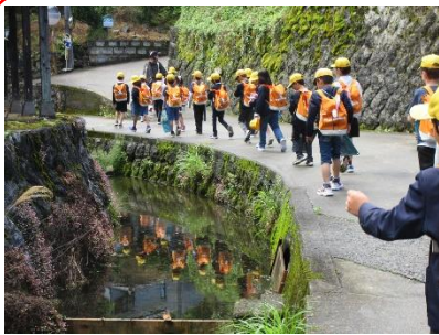
3年地域探検 5/20 枝折のまち探検に出かけ、地域の魅力を発見しました。