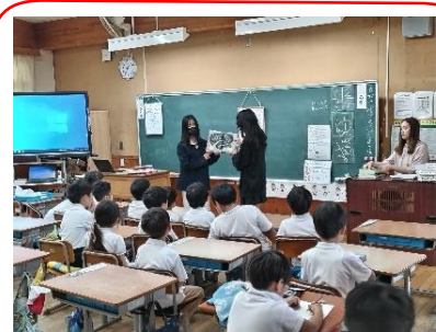
読み聞かせ（図書委員会） 6/20 図書委員会が今年の新しい活動として、各クラスでの読み聞かせを始めました。下学年の子どもたちにも大変好評みたいです。