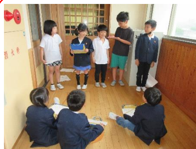
2年低学年交流 5/28 頼りになるお兄さんお姉さんとして、1年生に校舎の案内をしっかりとやり遂げました。