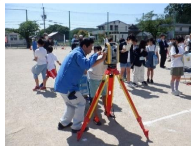
6年測量体験 6/4 測量技術協会が主催する体験教室に6年生が参加をしました。国土地理院の方から地図作りについて話を聞いた後、運動場で機器を使った測量を行い、普段はできない体験を楽しみました。