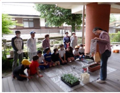
花いっぱい活動（お花の交流会） 5/27 地域の方と一緒に SDGs 委員会がへちまの苗を植えました。育った苗は地域の施設や中学校のプラネタリウム交流会でお配りしました。